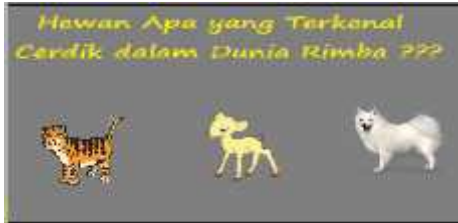
Gambar 5. Tampilan Quiz Game Level 1

Apabila pemain sudah melewati semua rintangan mulai level satu sampai level lima maka pemain akan sampai di akhir misi yaitu menemukan timun emas. Berikut adalah Gambar 6 yang menunjukkan tampilan misi complete.