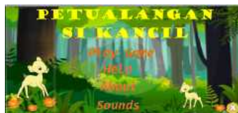
Gambar 3. Menu Utama Game Petualangan Si Kancil

Tampilan menu utama pada game petualangan si kancil tersebut terdapat lima menu yang antara lain menu play game berisi 5 level, menu Help yang berisi petunjuk dan rintangan pada permainan, menu about berisi data diri programmer , menu sound berisi perintah on atau off suara, dan menu exit ketika ingin keluar dari aplikasi game tersebut. Lebih jelasnya bisa dilihat pada Gambar 3 di bawah ini.