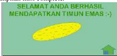
Gambar 6. Tampilan Misi Complete

Apabila pemain sudah melewati semua rintangan mulai level satu sampai level lima maka pemain akan sampai di akhir misi yaitu menemukan timun emas. Berikut adalah Gambar 6 yang menunjukkan tampilan misi complete.