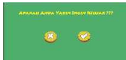
Gambar 11. Menu Exit

Tampilan menu Exit akan muncul ketika pemain ingin keluar dari program aplikasi berikut tampilannya yang ditunjukkan pada Gambar 11 di bawah ini.