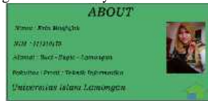
Gambar 10. Menu About

Gambar 10 merupakan tampilan menu about yang menampilkan data diri programmer, berikut tampilan lebih jelas dari gambar tersebut yaitu di bawah ini.