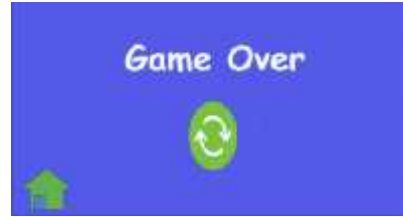
Gambar 8. Game Over

Tampilan tersebut akan muncul ketika pemain gagal dan nyawa pemain tersebut habis pada saat memainkan level permainan, berikut adalah tampilannya yang ditunjukkan Gambar 8 di bawah ini.