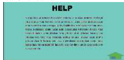
Gambar 9. Tampilan Menu Help

Menu help tersebut berisi penjelasan lebih detailnya untuk melakukan permainan agar pemain bisa menyelesaikan misi sesuai dengan alur permainan yang dibuat. Berikut untuk lebih jelasnya dapat dilihat pada Gambar 9 di bawah ini.