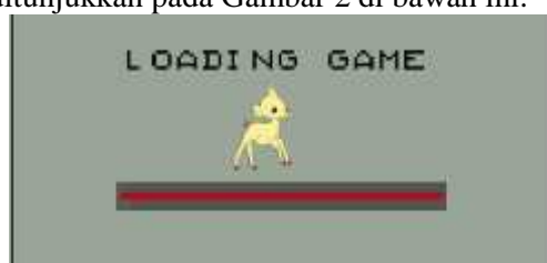
Gambar 2. Loading game Petualangan Si Kancil

Tampilan loading game ini berfungsi sebagai splash screen waktu tunggu saat awal pertama membuka Game Petualangan Si Kancil. Splash screen sebagai intro dari sebuah aplikasi berperan penting untuk menambah kredibilitas aplikasi. Gambar splash screen sebisa mungkin disajikan secara menarik dan ringan agar pengguna tertarik pada aplikasi game tersebut. Berikut adalah tampilannya yang ditunjukkan pada Gambar 2 di bawah ini.