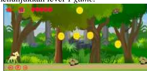
Gambar 4. Level 1 Game Petualangan Si Kancil

Tampilan level 1 merupakan level awal yang rintangannya lebih mudah, game ini dimulai dari seekor kancil yang mempunyai misi untuk menemukan timun emas, nyawa musuh pertama yaitu kecoa ada satu sehingga untuk melanjutkan level kedua, pemain harus bisa membasmi kecoa tersebut hingga nyawanya habis dan ketika nyawa habis maka pemain akan menemukan petunjuk sebuah tanda panah untuk melanjutkan ke level selanjutnya. Pemain juga dapat memperbanyak point dengan mengumpulkan beberapa koin emas yang ada pada setiap perjalanannya. Kemudian untuk penjelasan tombol-tombol yang ada pada level 1 tersebut terdapat tambahan tombol pause ketika pemain ingin melakukan pemberhentian sejenak pada permainan yang dimainkan, terdapat tombol on atau off suara pada permainan serta terdapat tombol home yang berfungsi untuk kembali ke menu utama game . Berikut adalah Gambar 4 yang menunjukkan level 1 game .