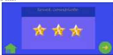
Gambar 7. Level complete

Tampilan tersebut akan muncul ketika pemain berhasil menyelesaikan level permainan, jumlah bintang yang dipeoleh sesuai dengan score yang didapat oleh pemain yaitu antara lain : pada level 1 mendapat bintang 1 dengan score 1-10, bintang 2 dengan score 11-25, dan bintang 3 dengan score lebih dari 26 untuk level seterusnya jumlah score yang harus di dapat juga semakin bertambah. Berikut adalah tampilannya yang ditunjukkan Gambar 7 di bawah ini.